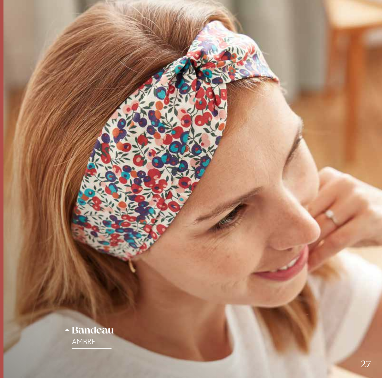
▲ Bandeau AMBRE