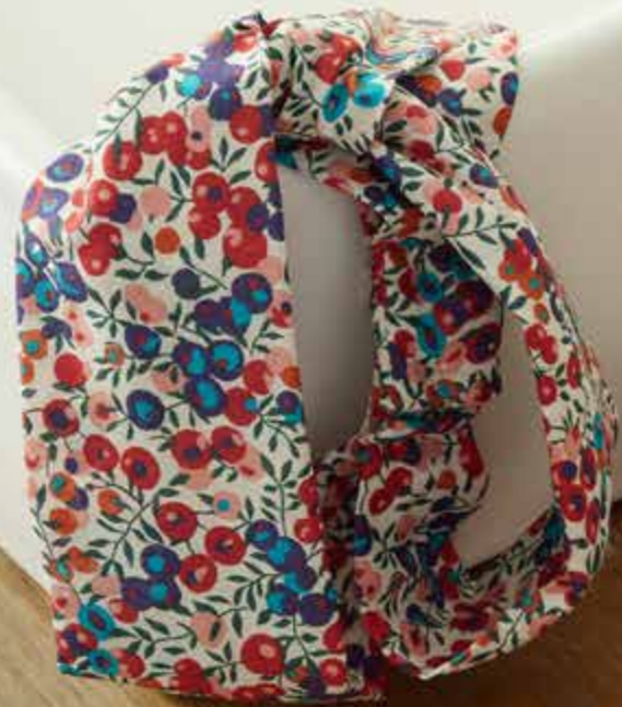
► Chouchou JADE