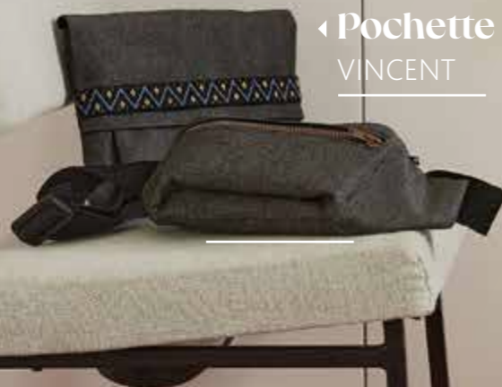
◀ Pochette VINCENT