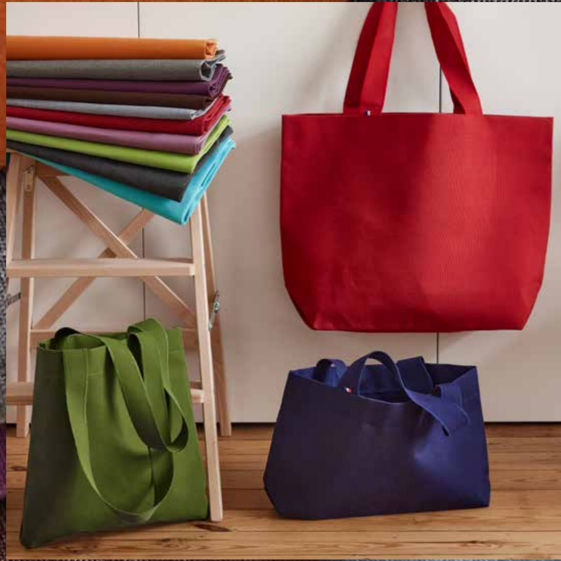
▲ Tote bag JEAN