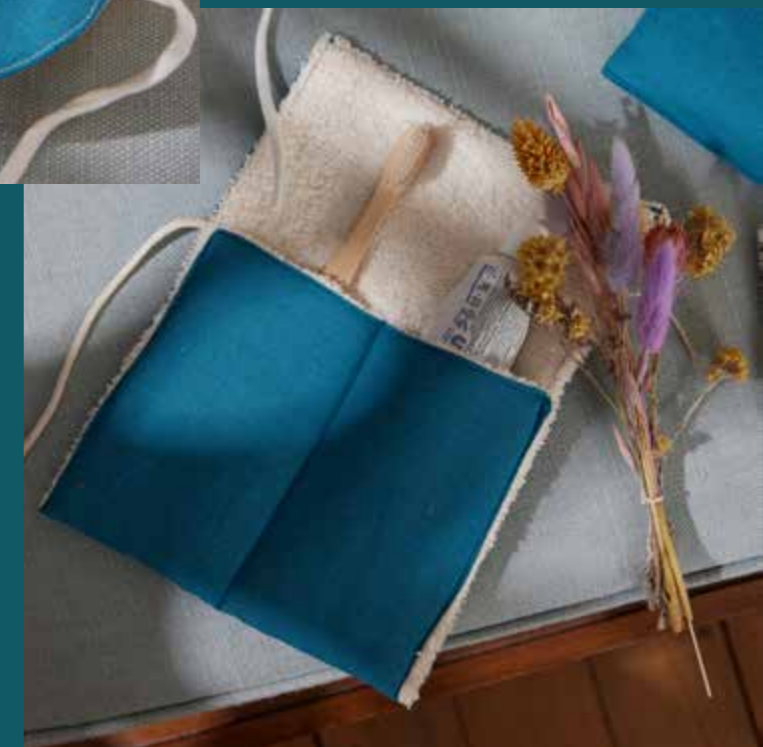
▶ Étui à brosse à dents BORA