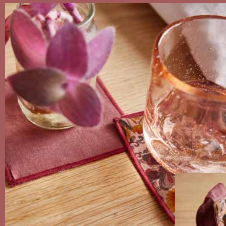
◀ Dessous de verre BERLIN