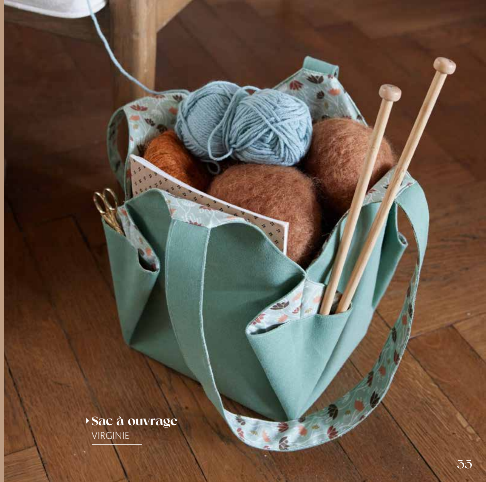
▸ Sac à ouvrage VIRGINIE