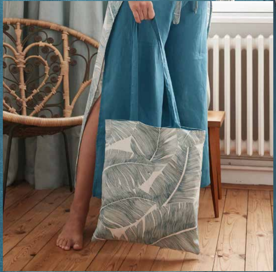
▲ Tote bag ANAÏS