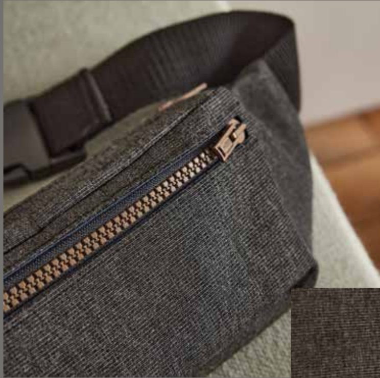
◀ Sac banane BEN