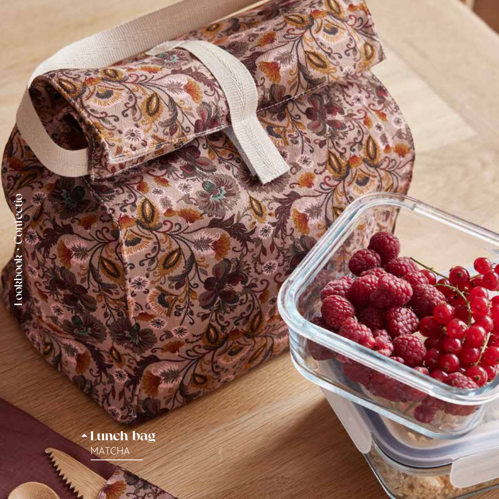
▲ Lunch bag MATCHA