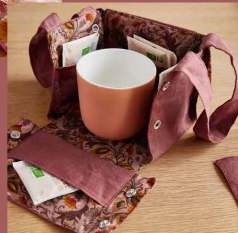
▶ Box à thé VERVEINE