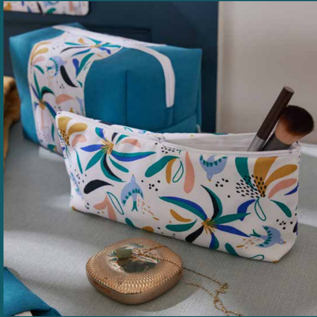
▲ Trousse à maquillage ZEPHYR