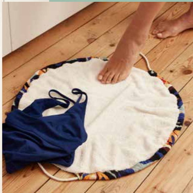
▲ Sac tapis ROSSIGNOL