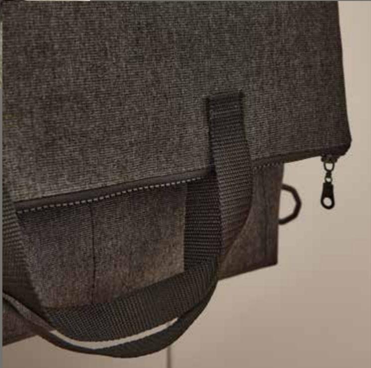
▸ Besace PIERRE