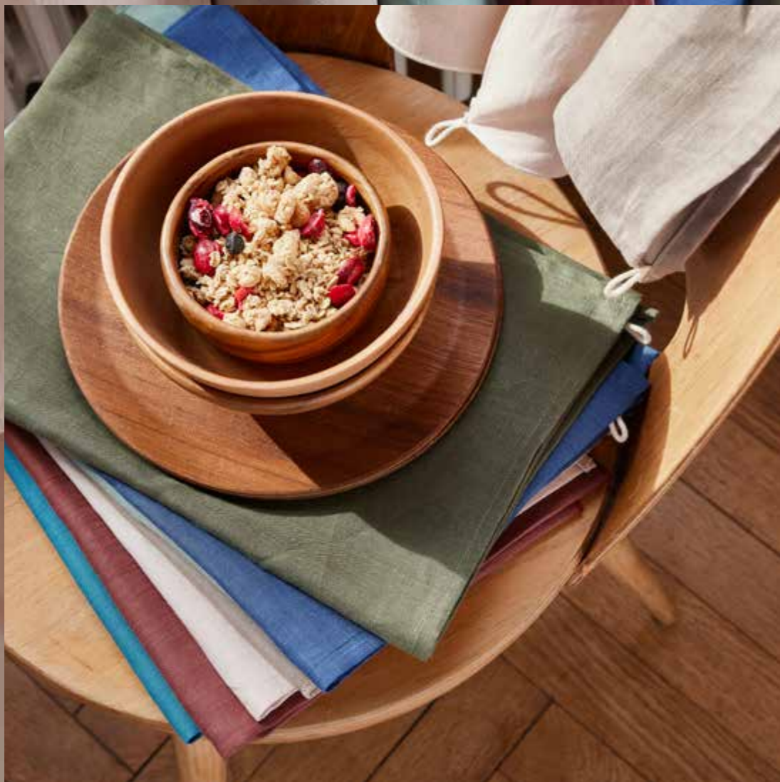
▲ Essuie-vaisselle SESAME