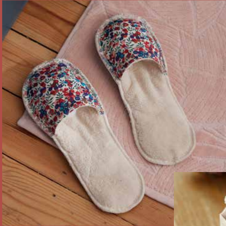
◀ Chaussons JASPE