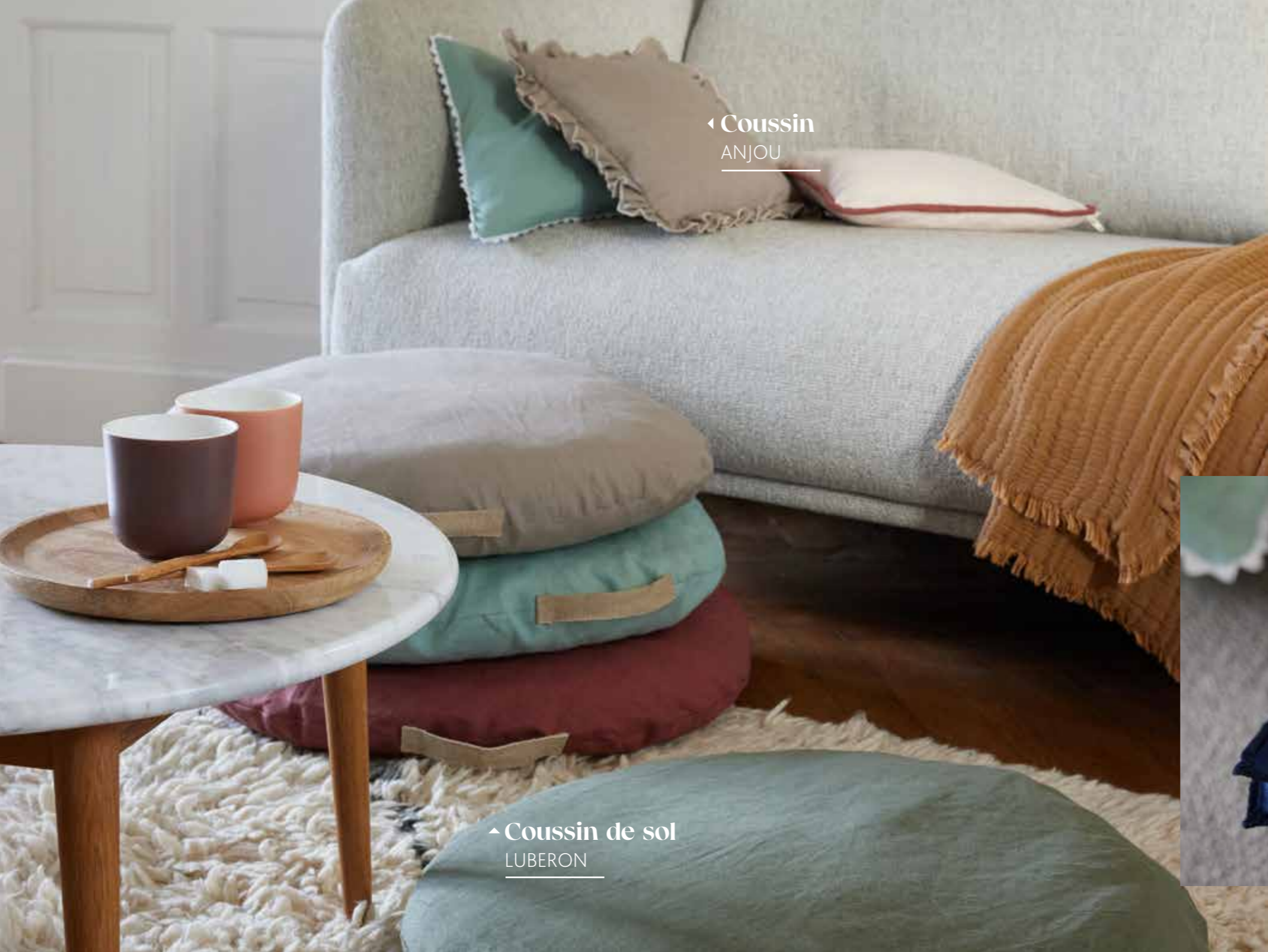
◀ Coussin ANJOU