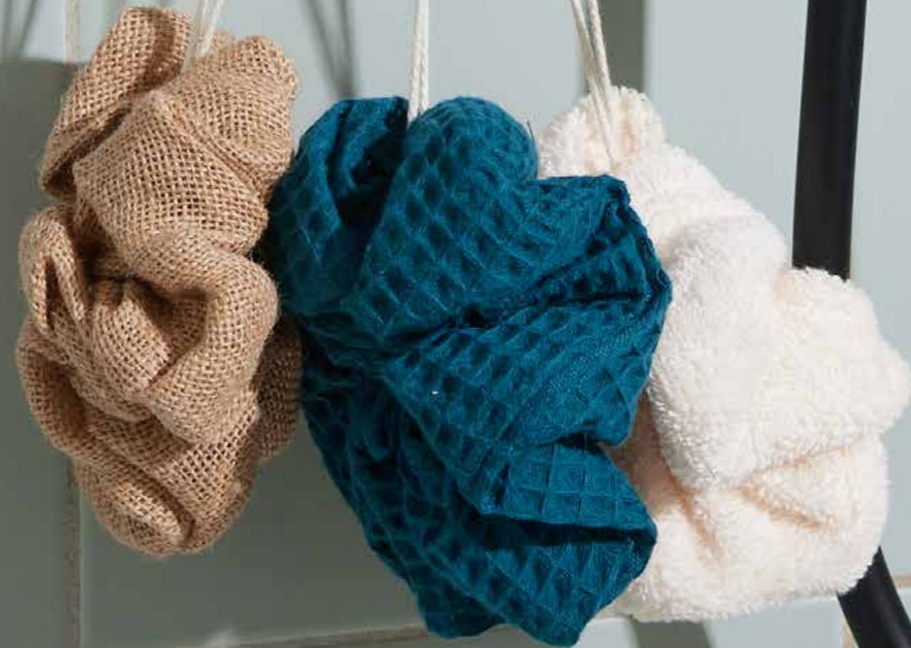
▲ Fleur de douche GALERNE