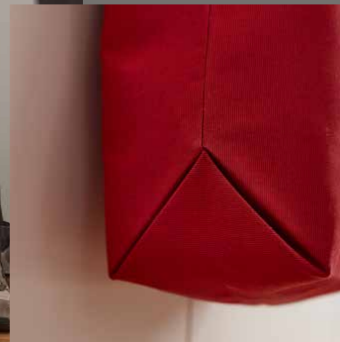
◀ Sac JACQUELINE

Avant j'étais un store, mais ça c'était avant !