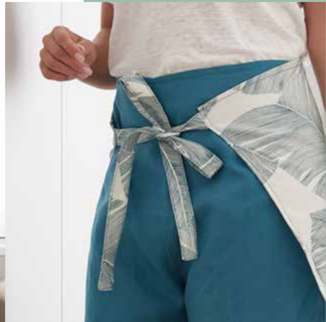
▶ Pantalon CAMUS