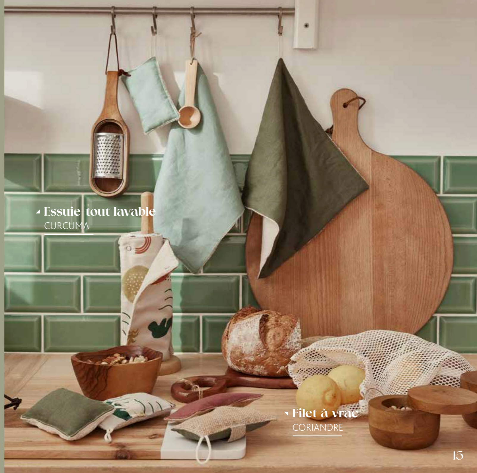
▲ Essuie-tout lavable CURCUMA