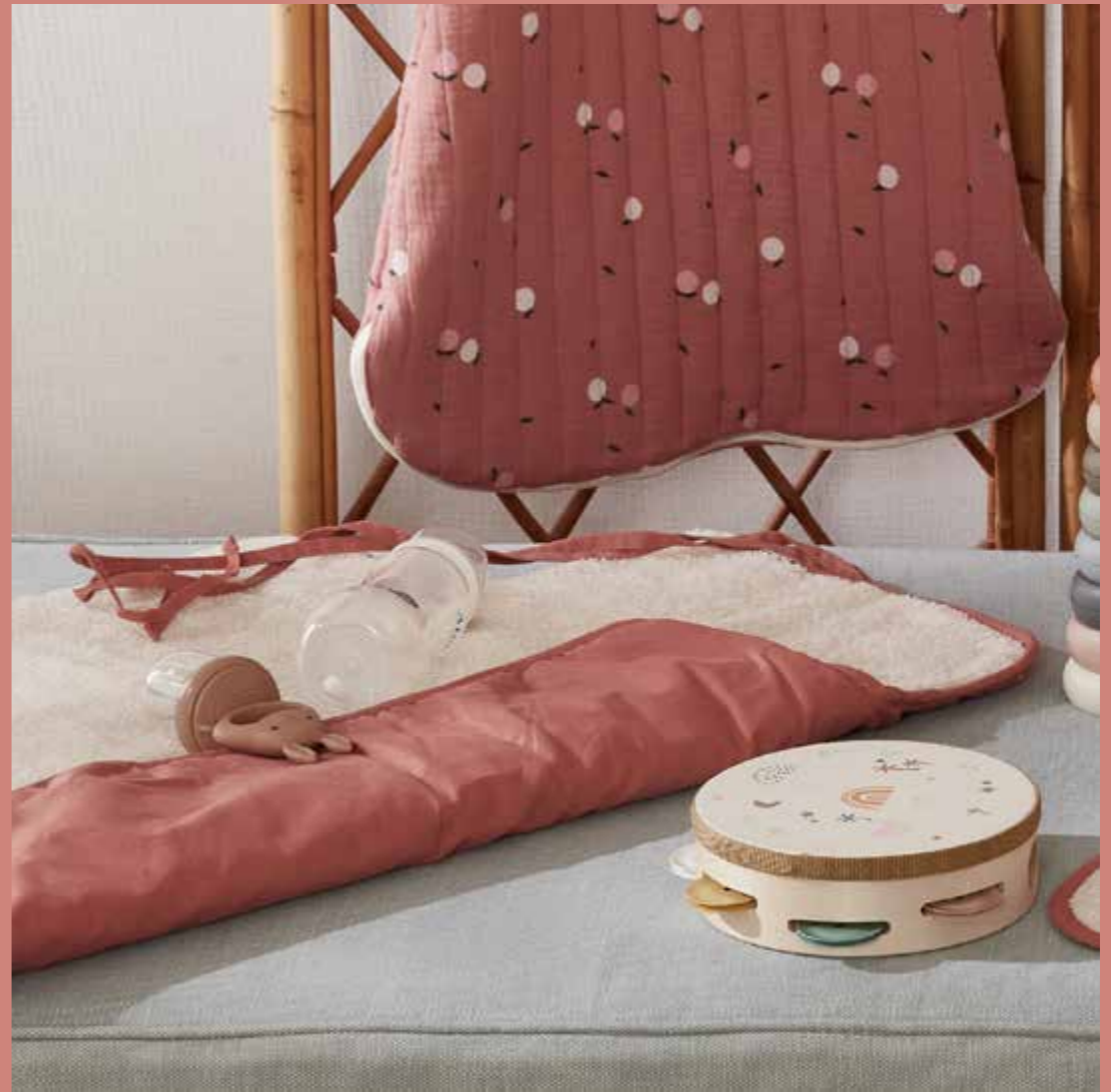
▲ Tapis à langer OLAF