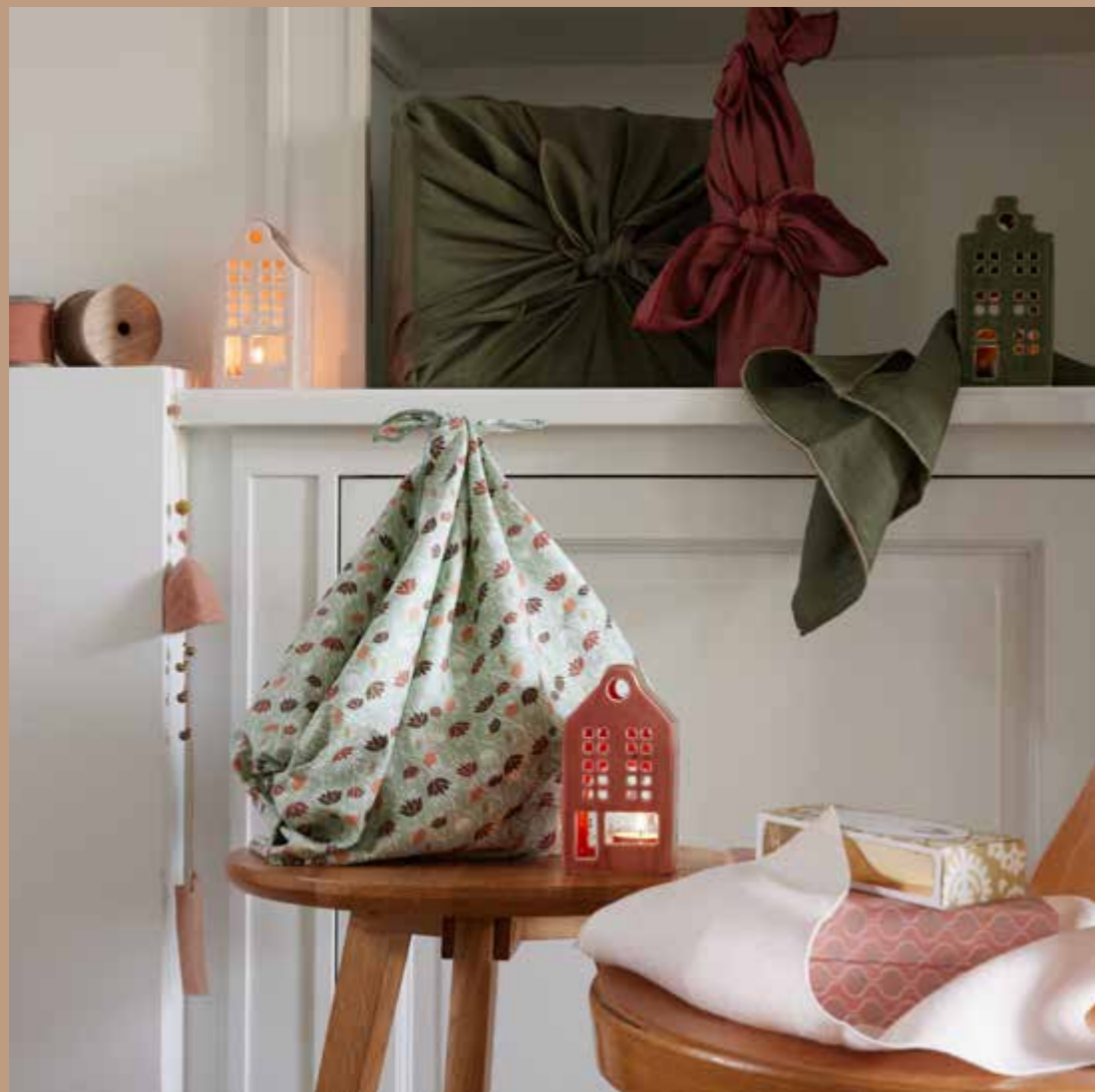
▸ Sac et emballage cadeau upcyclé FUROSHIKI