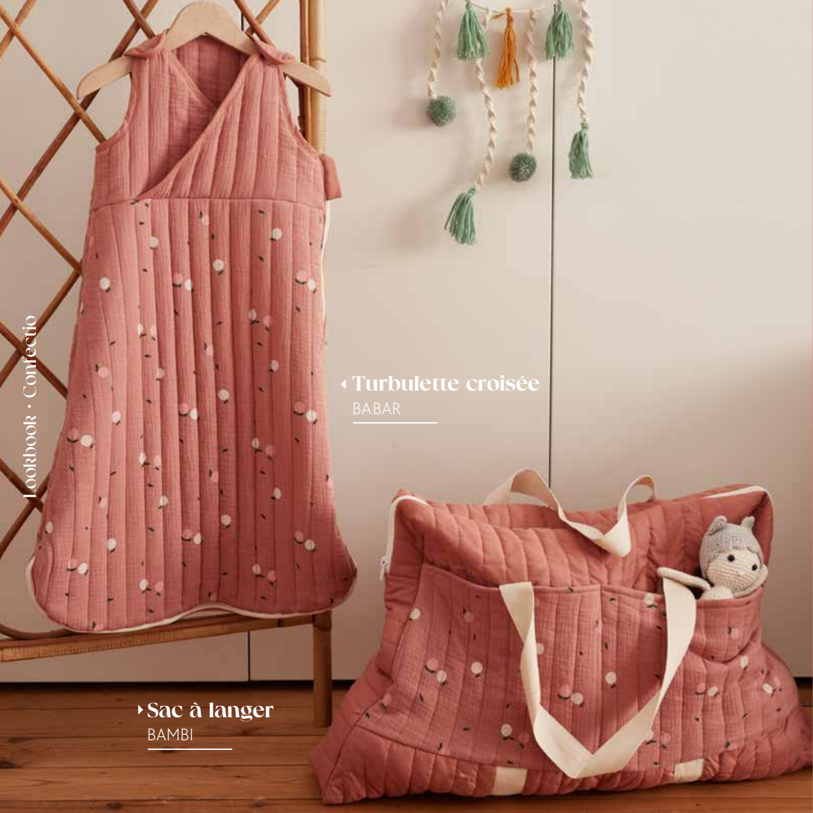
◀ Turbulette croisée BABAR