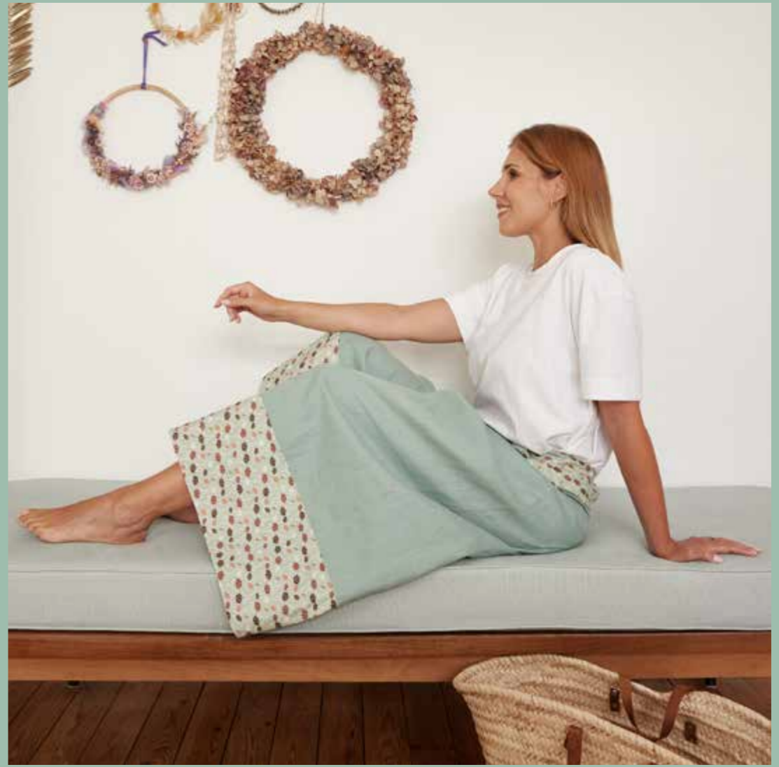
▲ Pantalon SAGAN