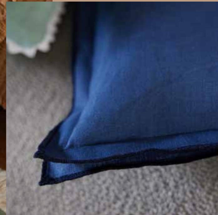
◀ Coussin SAUTERNES