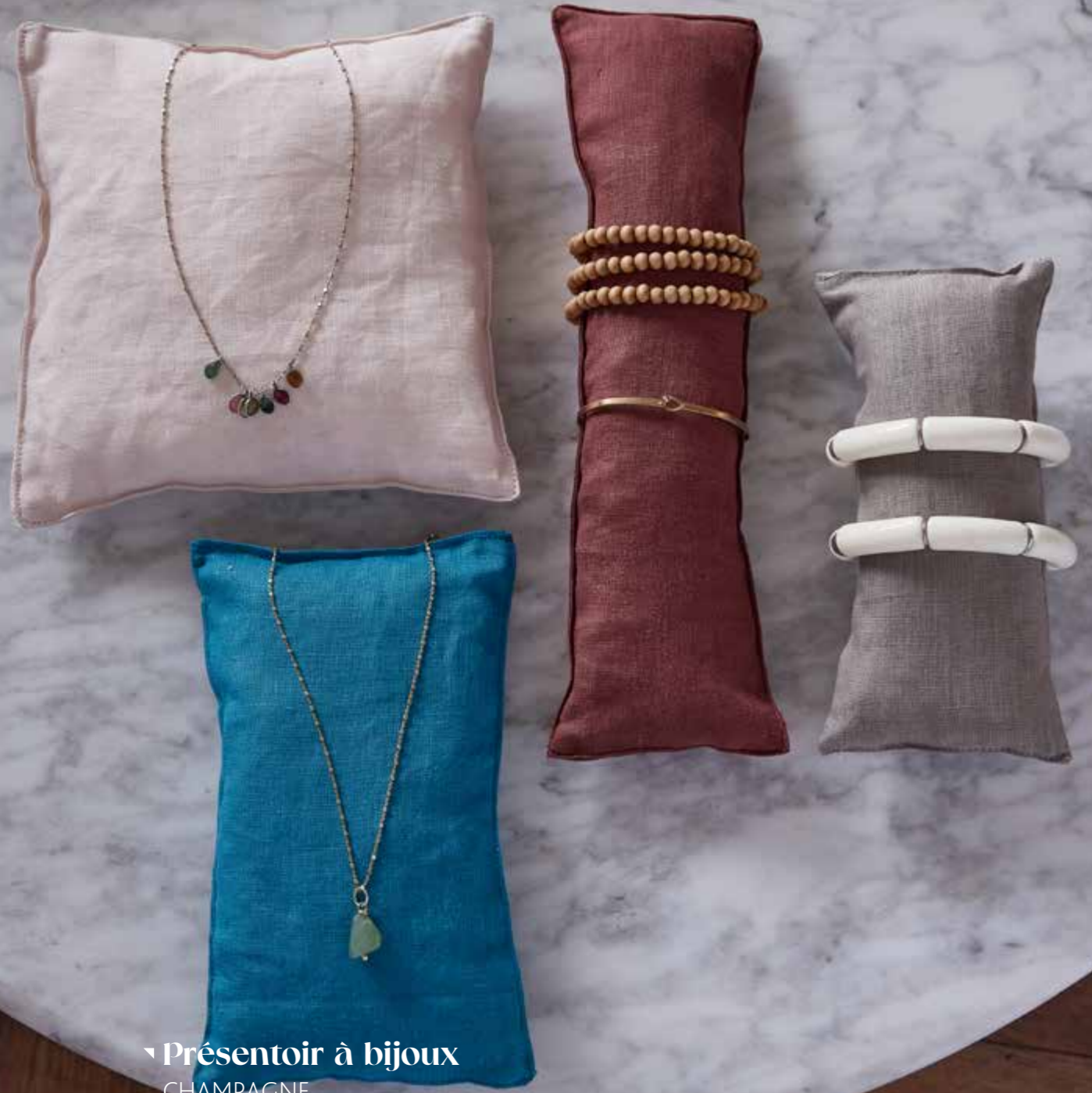
▾ Présentoir à bijoux CHAMPAGNE