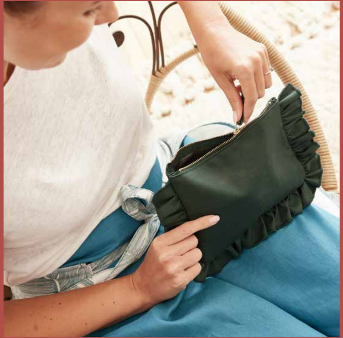
▸ Pochette CHOUETTE