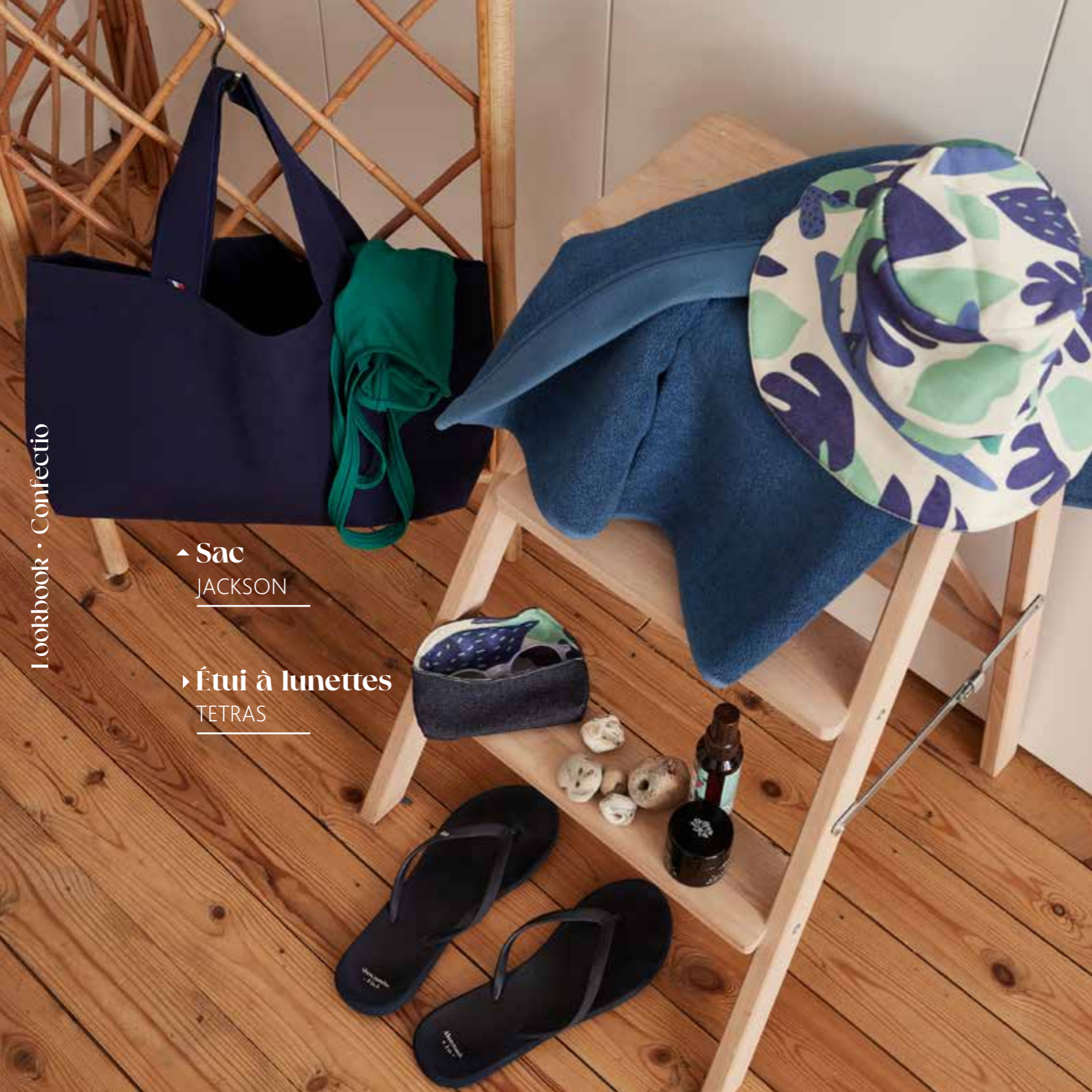
▶ Étui à lunettes TETRAS