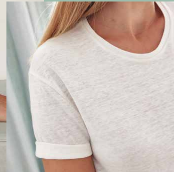
◀ Tee-shirt lin ARAGON