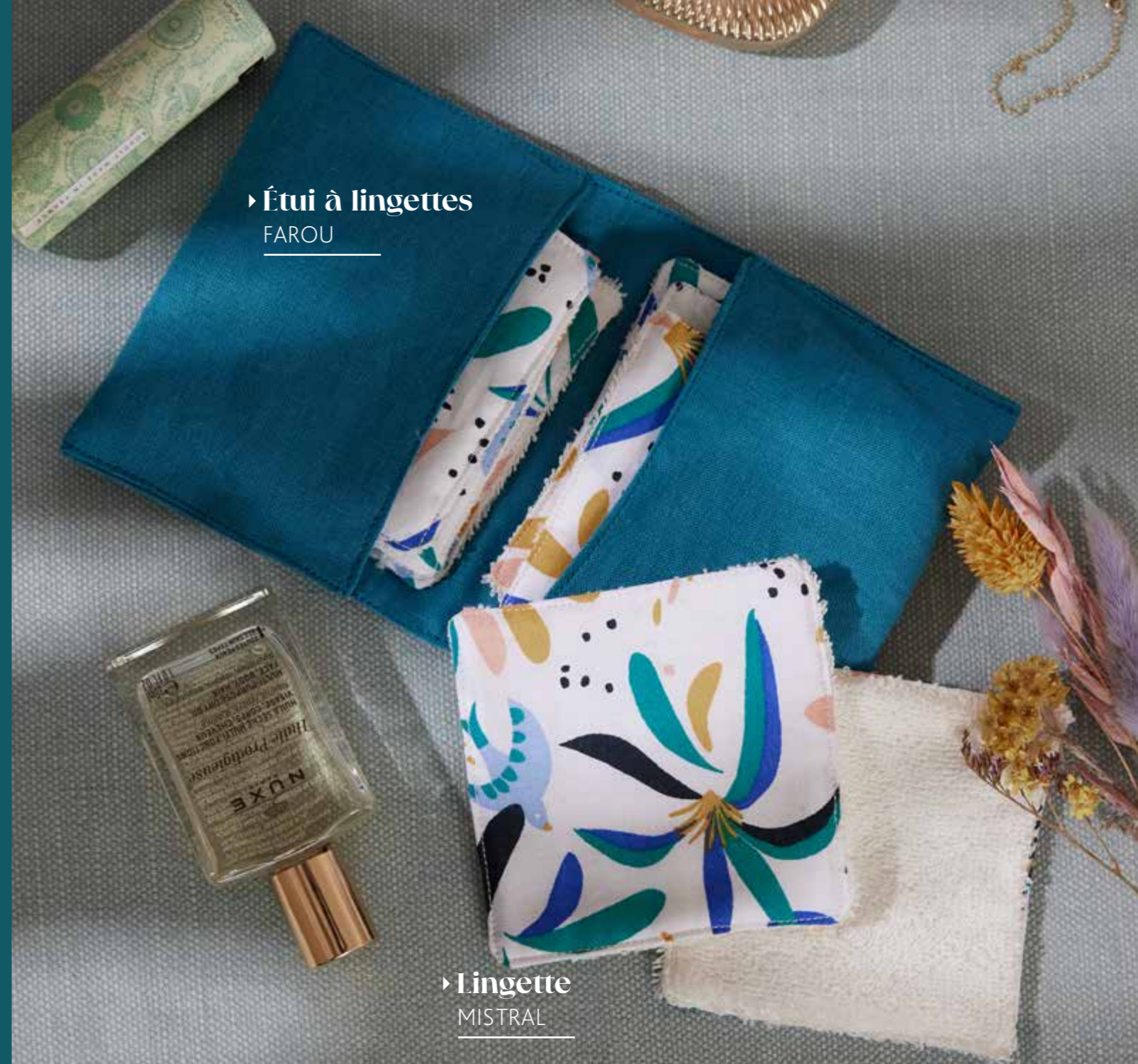
▶ Étui à lingettes FAROU