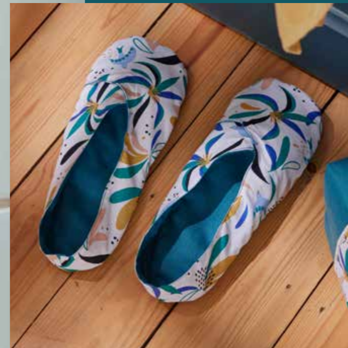
◀ Chaussons ALIZE