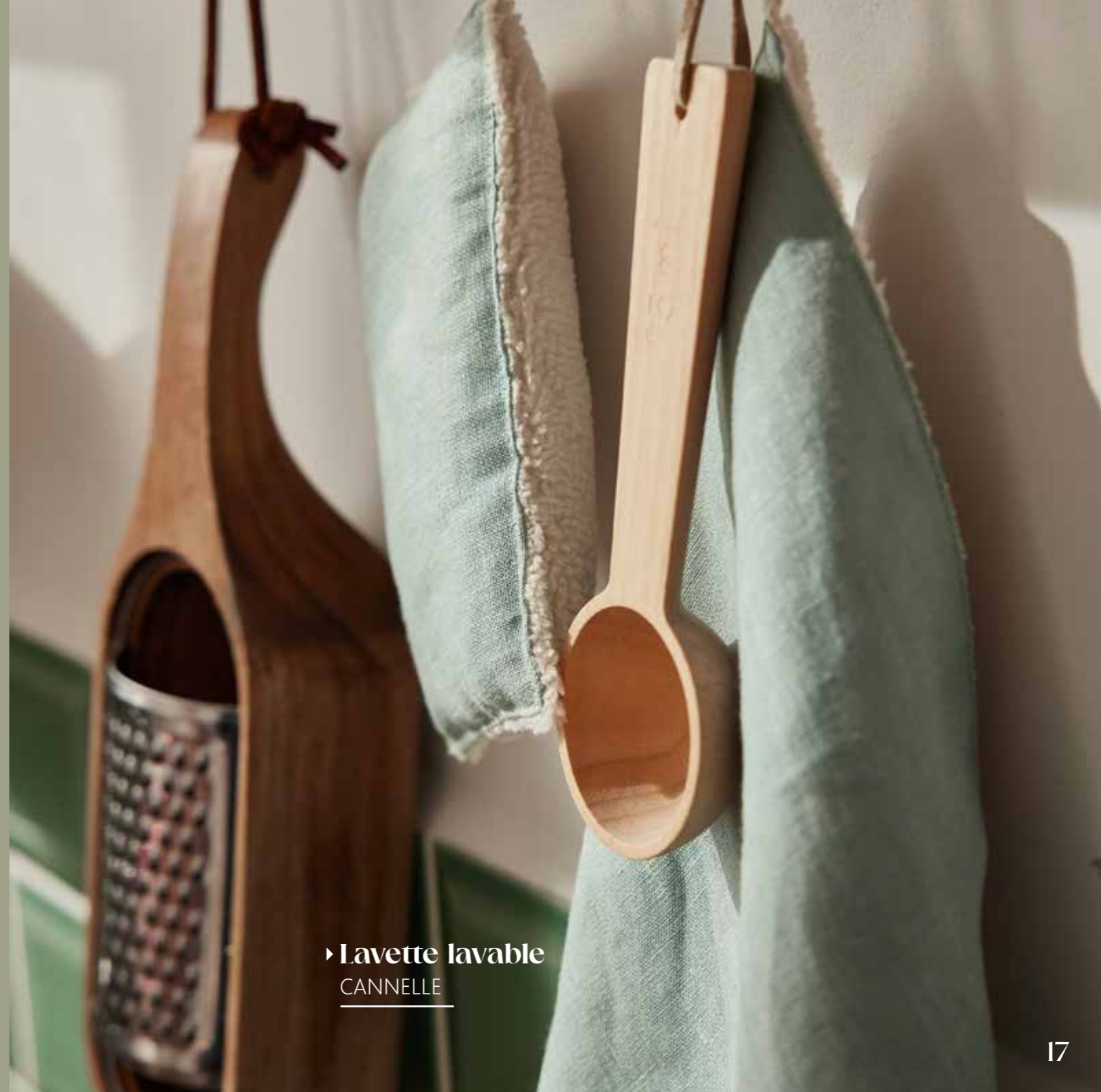
► Lavette lavable CANNELLE