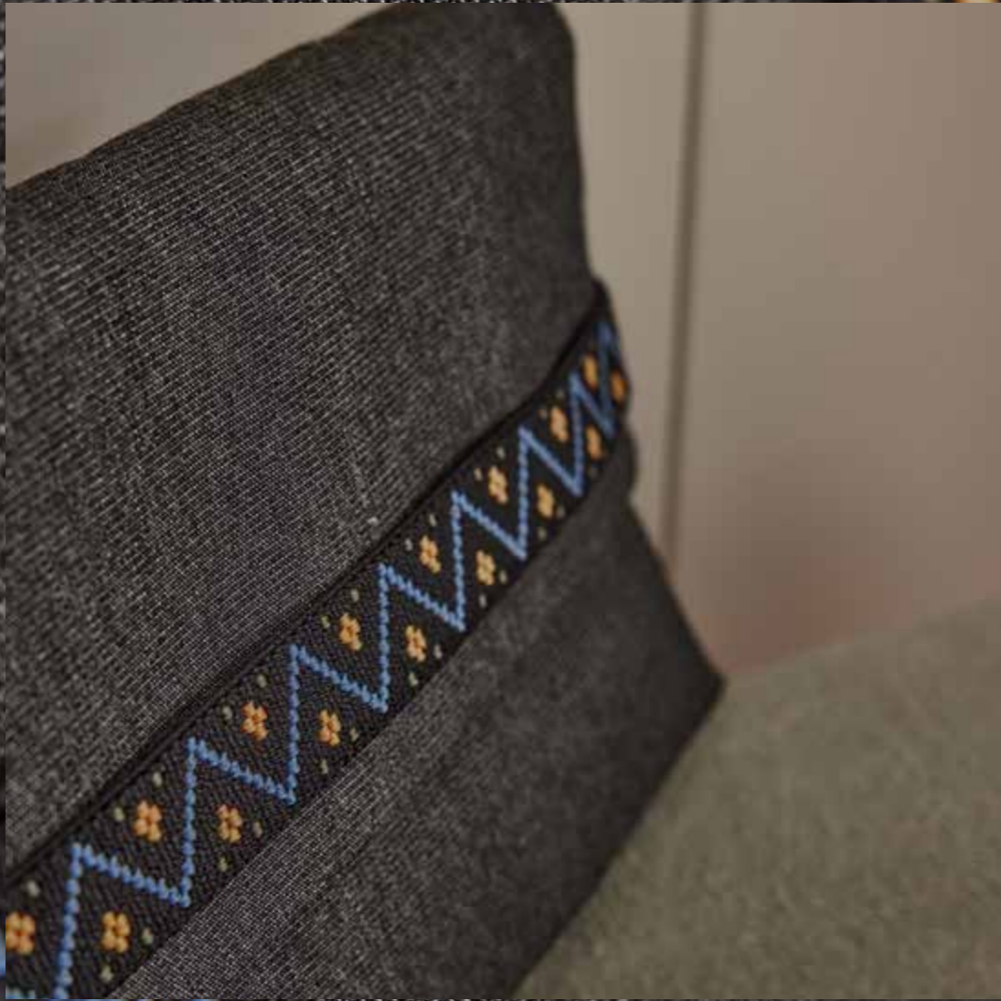
▸ Pochette VINCENT