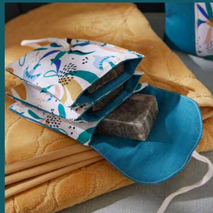
◀ Étui à savons BISE