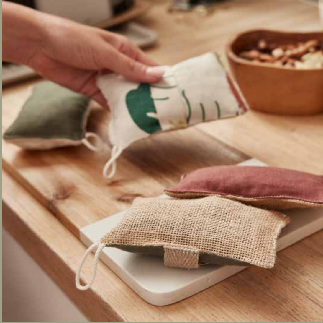
▲ Éponges lavables ANETH