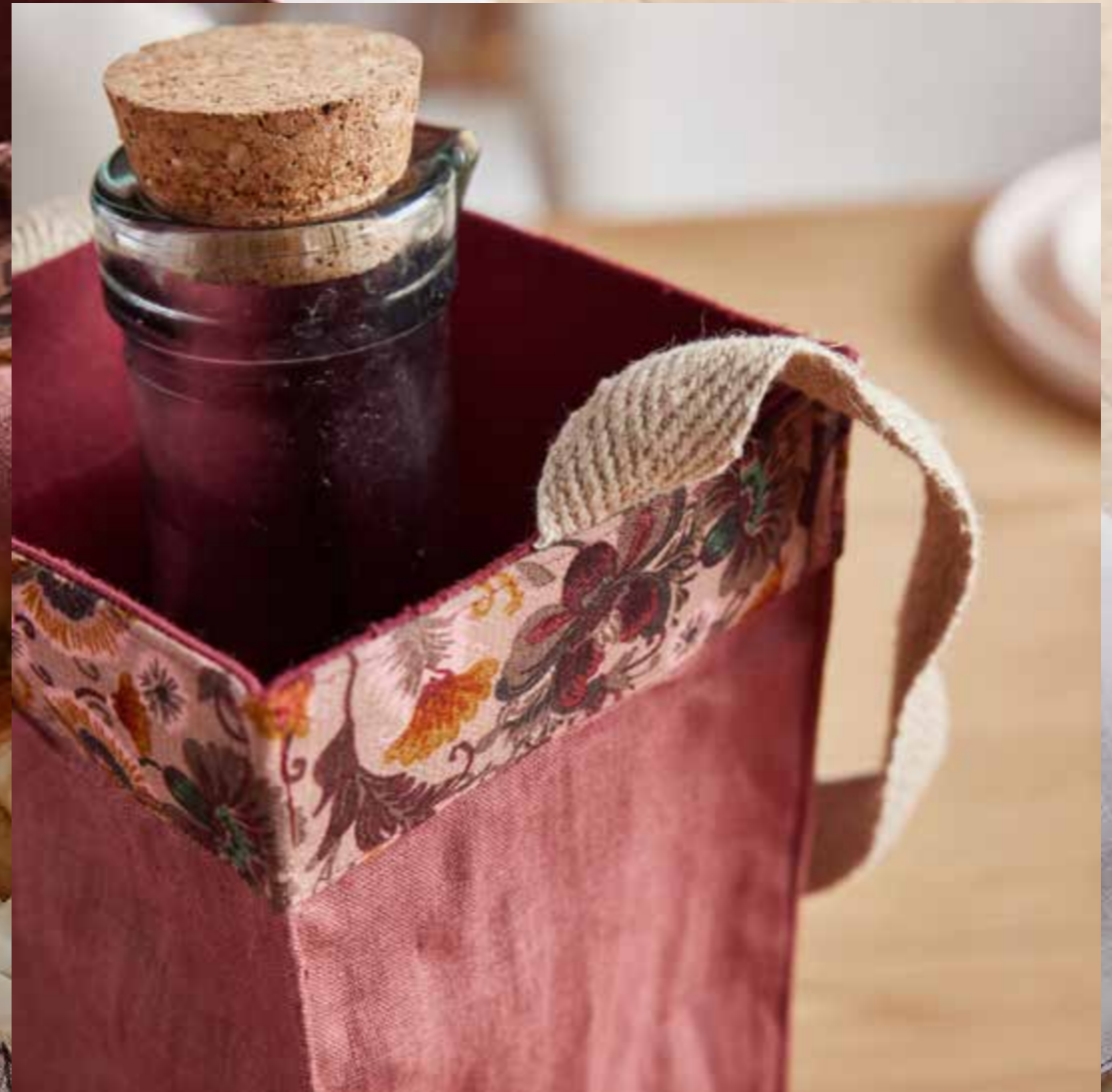
▲ Porte-bouteille CARACAS