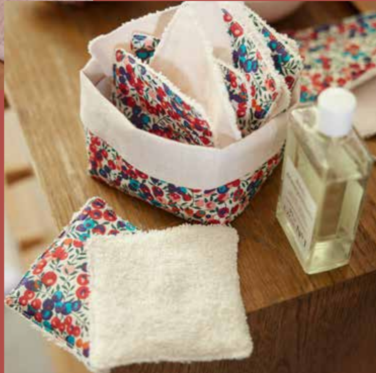
▶ Panière à lingettes SIMOUN