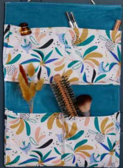
◀ Organiseur MOUSSON