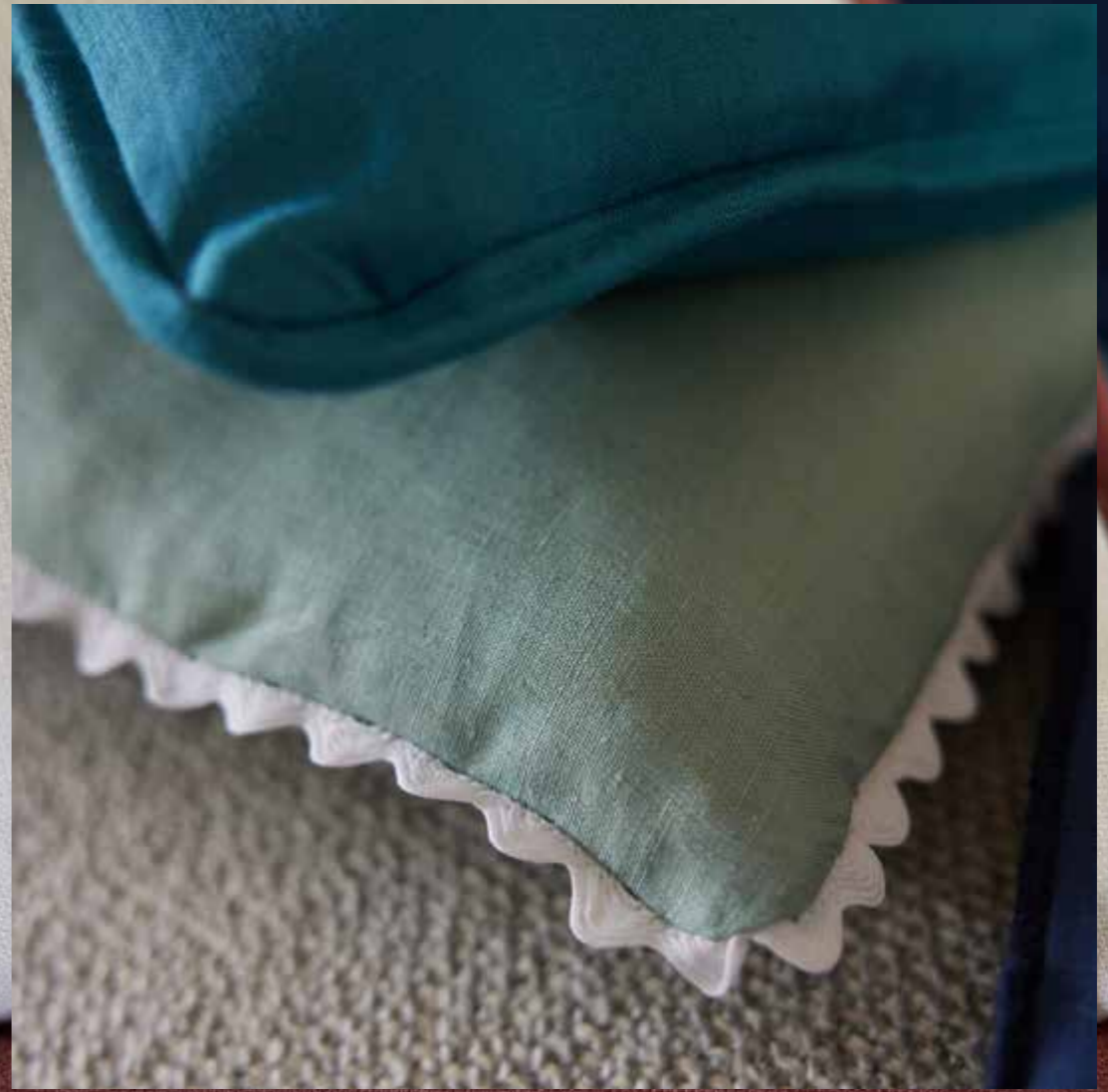
▴ Coussin CHABLIS