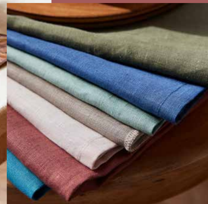
◀ Serviettes de table MALABO