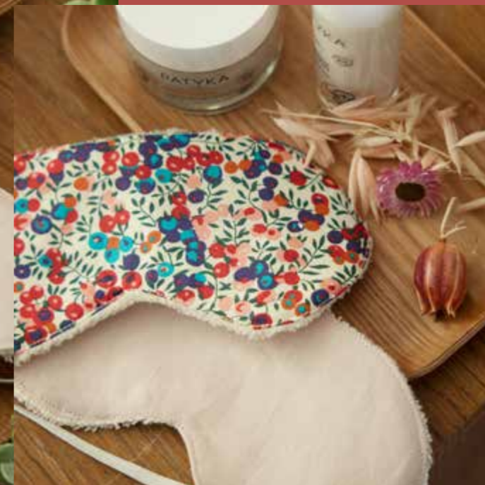
◀ Masque AGATHE